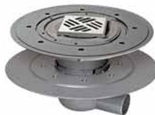
L'illustration montre Réf. # 40 159.50

Rehausse pour étanchéité à enduit liquide Variofix en ABS, avec bride à coller et contre-bride, avec membrane d'étanchéité livrée selon EN 1253-1 et DIN 18534-1-W3-I, avec double reprise d'étanchéité, grille 95 × 95 mm en acier inoxydable AISI 304, hauteur de revêtement de 6 à 14 mm, classe K 3